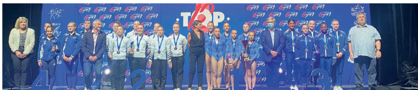
Podium 2022 : Avoine / Haguenau / Meaux / Schiltigheim