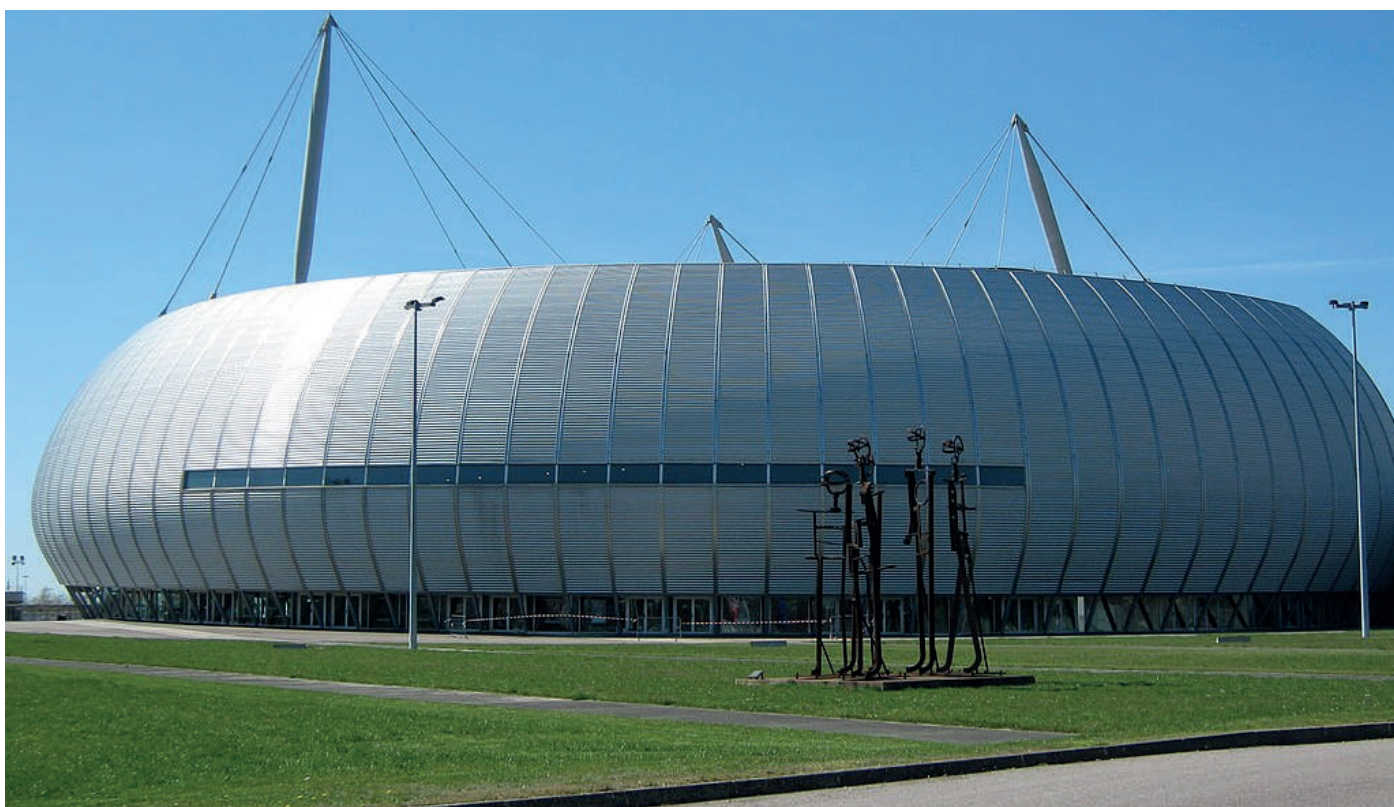
Zénith de Rouen

Les 29 et 30 avril, le Zénith de Rouen et le comité régional de Normandie accueilleront la finale et le match de classement pour la 3ème place du Top 12. Les meilleures équipes de gymnastique artistique féminine et masculine de la saison s'affronteront dans des duels gymniques de haut vol pour s'emparer du titre de champion de France Top 12. L'élite de la Gymnastique française se donne donc rendez-vous pour un show spectaculaire. Un seul club montera sur la plus haute marche du podium.