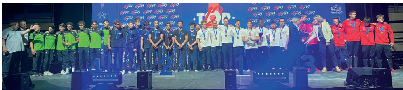
Podium 2022 : Noisy / Antibes / Sotteville / Monaco