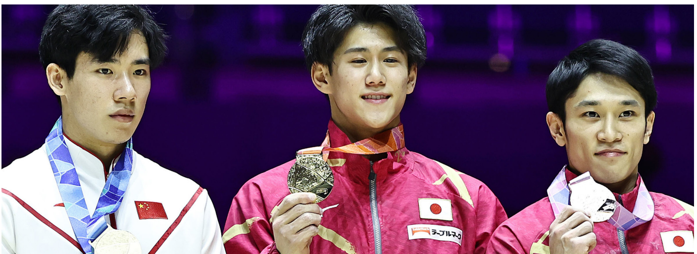
Podium du concours général masculin des championnats du monde 2022 à Liverpool (GBR)