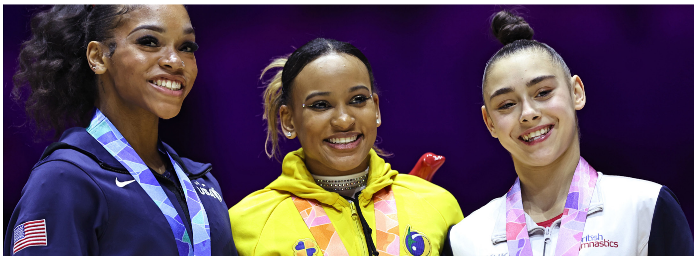
Podium du concours général féminin des championnats du monde 2022 à Liverpool (GBR)