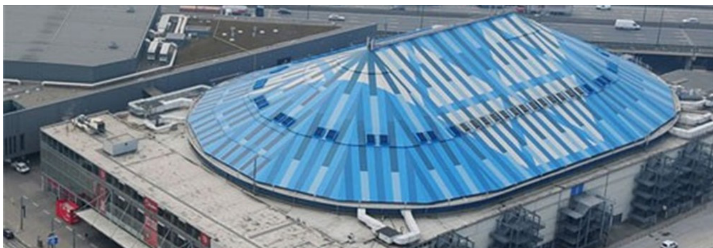
The sportpaleis

Cent-vingt ans après avoir accueilli les tout premiers championnats du monde de gymnastique artistique, la ville d'Anvers s'apprête à recevoir la 52e édition qualificative pour les Jeux olympiques de Paris. C'est au sein de l'Antwerp Sportpaleis que les meilleurs gymnastes de la planète se retrouveront du 30 septembre au 8 octobre 2023. À l'issue de la compétition, 9 nouvelles nations, chez les femmes comme chez les hommes, décrocheront les derniers billets olympiques par équipe.