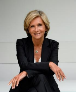
Valérie Pécresse Présidente de la région Ile-de-France

Soutenons tous les sports en Ile-de-France !