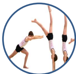
Activités Gymniques Acrobatiques