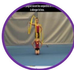
Activités Gymniques d'Expression