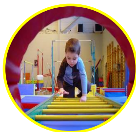
Activités d'Eveil Gymnique pour la Petite Enfance