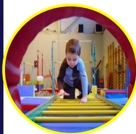
Activités d'Eveil Gymnique pour la Petite Enfance