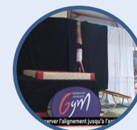
Activités Gymniques Acrobatiques