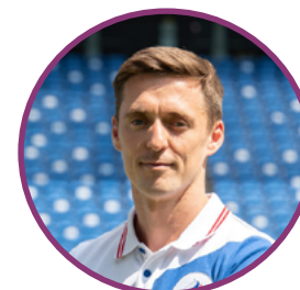
DIMITRI USHAKOV RUSSIE