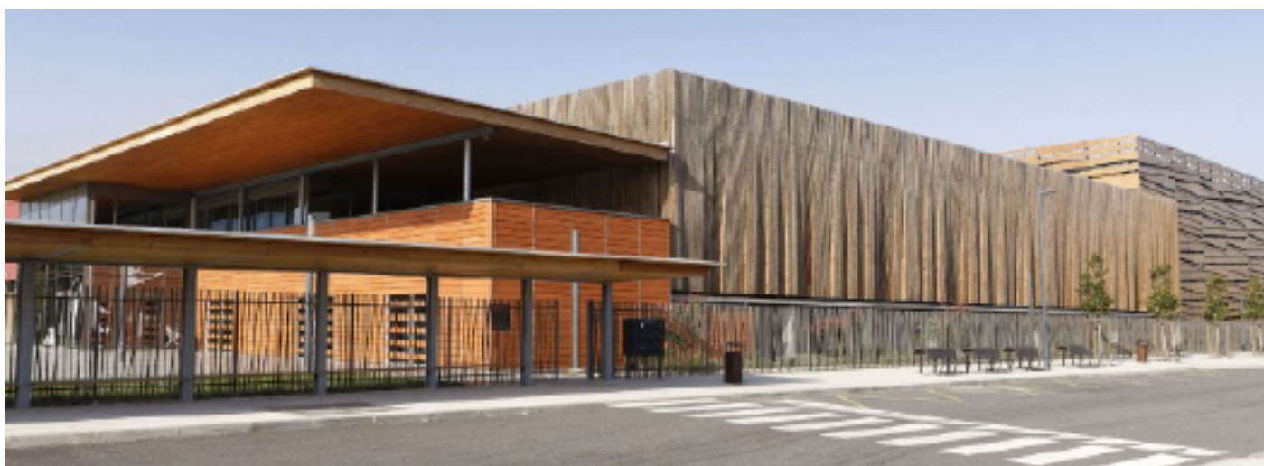
La maison des activités gymniques

Quelques mois après les Jeux olympiques de Tokyo, le gratin du trampoliner mondial se retrouvera à Colomiers (31) à l'occasion d'une compétition exceptionnelle : le Colomiers French Open ! En amont de ce rendez-vous international, les 15 et 16 octobre, une compétition nationale destinée aux meilleurs trampolinistes et tumbleurs du pays, le Masters Open, sera également organisée à Colomiers. Le lendemain, le 17 octobre, les jeunes trampolinistes, à l'instar de leurs idoles, bénéficieront aussi des très belles installations pour se confronter à l'occasion de l'Anim'Open Cup.