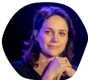
Nathalie PÉCHALAT Internationale de patinage artistique