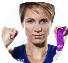
Céline DUMERC Internationale de basket-ball