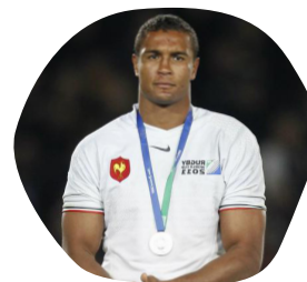
Thierry DUSAUTOIR International de rugby à XV