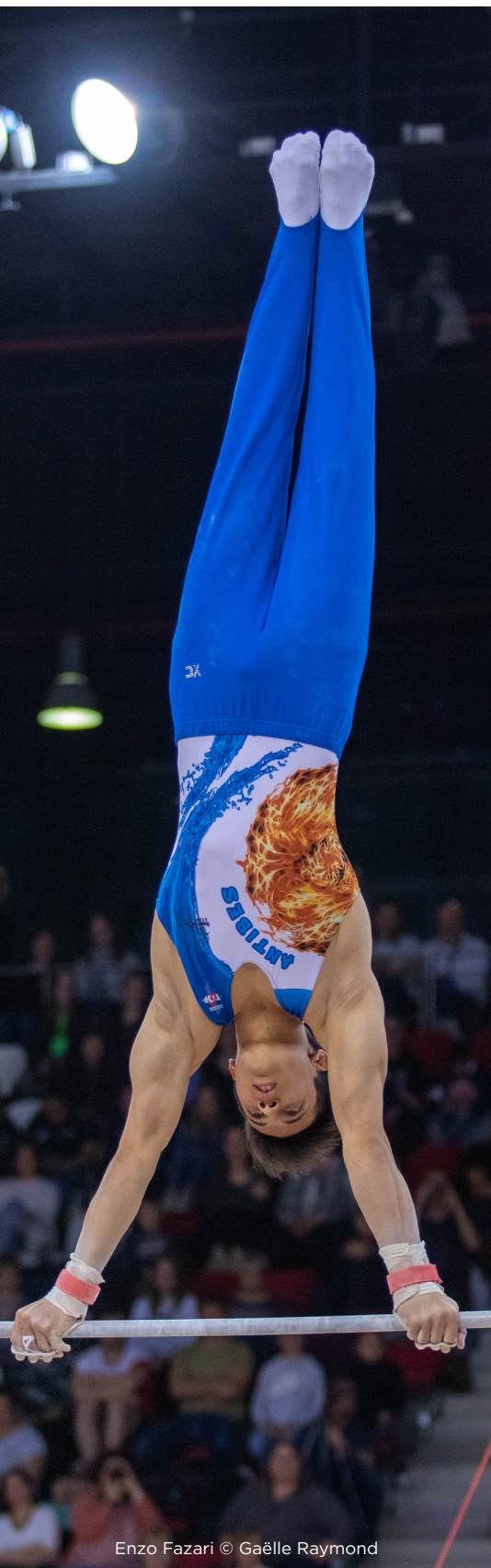
Enzo Fazari © Gaëlle Raymond