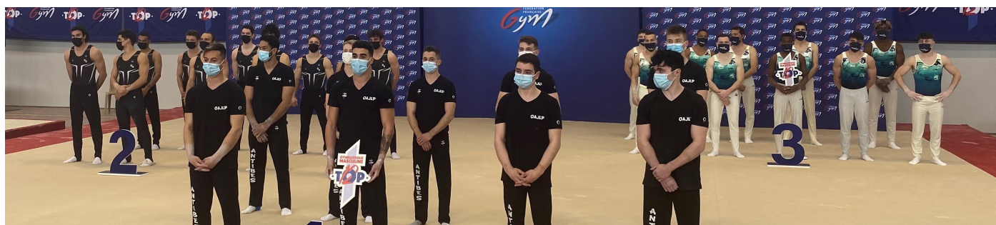
Podium 2021 : Noisy / Antibes / Vallauris