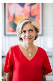
Valérie Pécresse Présidente de la Région Île de France

Nous souhaitons le plus grand succès à ce bel événement !