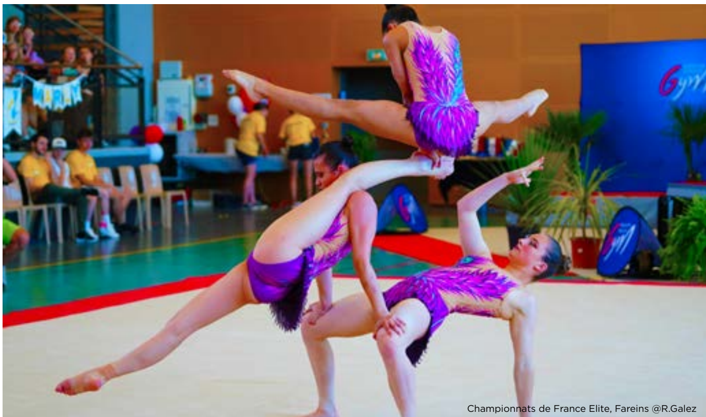
Championnats de France Elite, Fareins

Côté JUNIOR , le club d'Antibes se présente avec un trio pour essayer de conserver ses titres de l'édition précédente. Talence pourrait avoir envie d'une revanche sur Antibes lors de ces Championnats de France afin de monter sur la plus haute marche du podium. Les Rennais auront eux aussi l'occasion de se démarquer pour aller chercher l'or comme leurs aînés l'an passé. Quatre autres clubs sont engagés en trio féminin : L'Avant Garde Albertville, le club Gym Trévoux, Marly Acrobat' Club et l'Union Sportive Cagnes Gymnastique.