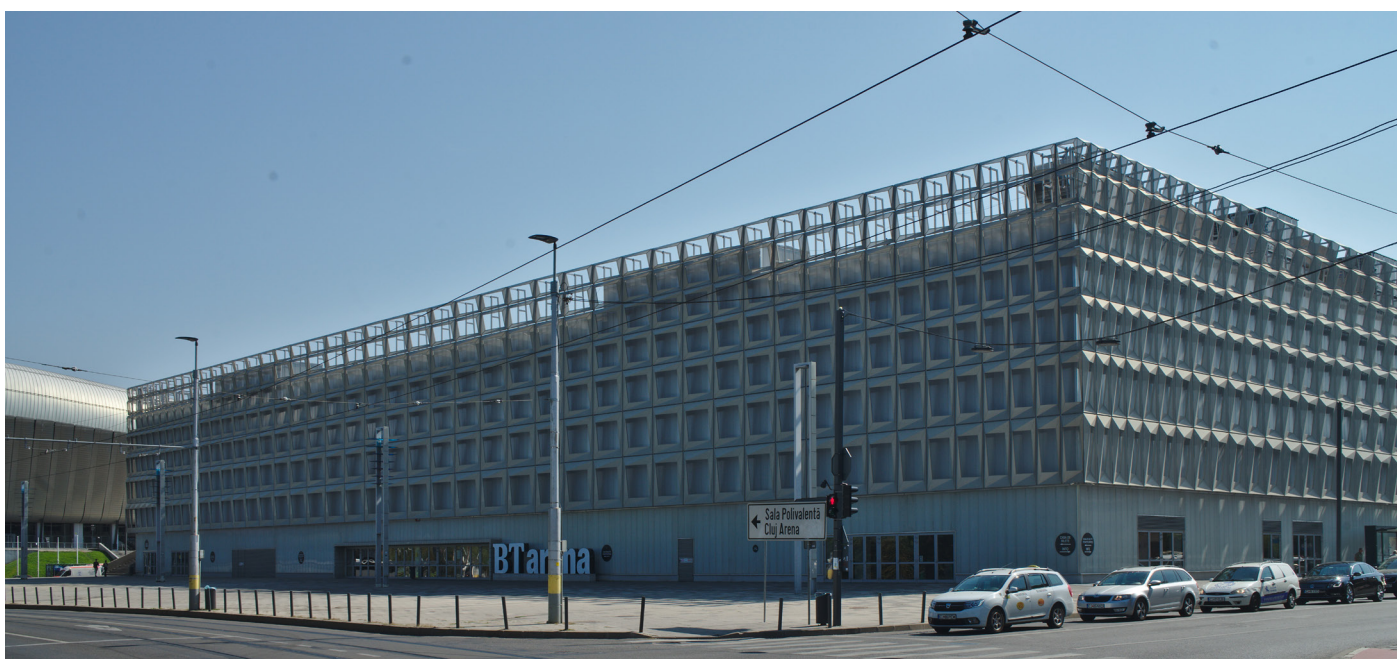
BTarena - © robert at made-by-architects.com

La ville de Cluj-Napoca en Roumanie sera le théâtre de la seconde édition des championnats du monde de gymnastique rythmique du 7 au 9 juillet. Les meilleures jeunes gymnastes de la discipline se retrouveront dans la BTarena, au cœur de la Transylvanie dans la ville européenne du sport 2018. Avec plusieurs grands festivals de musique ou festivals de cinéma à son actif, Cluj-Napoca est également connue pour sa dimension culturelle vibrante et dynamique.