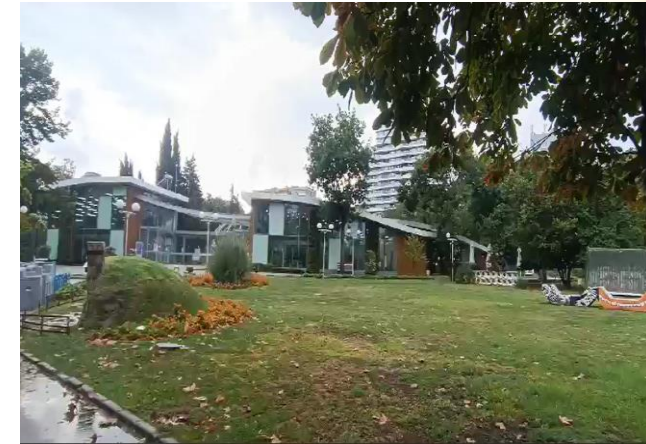
Espace parc floral