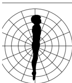
Buste à la verticale