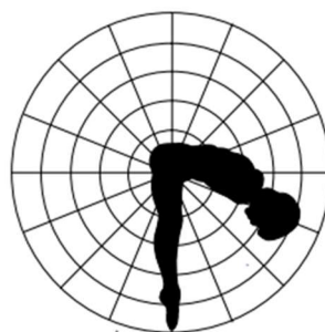
Buste à plus de l'horizontale

Vision aveugle : Donc la réponse faite étant en lien Question « Est-ce qu'une difficulté qui ne compte pas (donc NR) dans la valeur de diff valide la vision aveugle ? » Réponse : « Non. La brochure stipule que le passage doit contenir une difficulté tentée (donc NR) ou prise en compte dans le calcul de la valeur de difficulté »